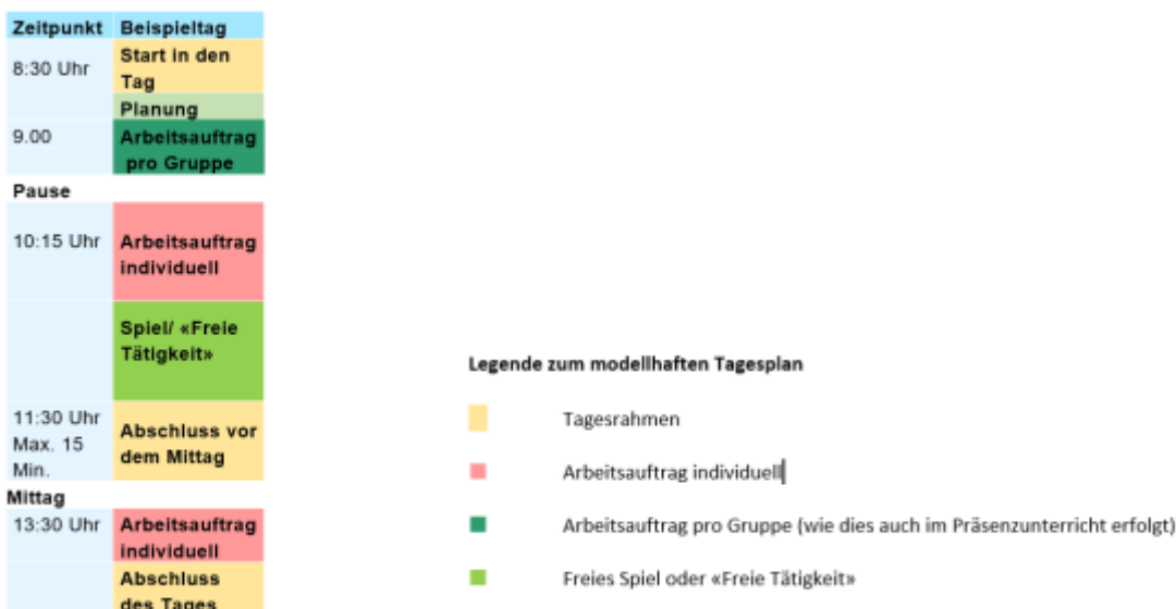
Tagesstruktur 1./2. Klasse der Primarschule

Eine Beschreibung der einzelnen Blöcke findet sich hier . Die „Arbeitsaufträge für Gruppen“ sind als Aufträge für bestimmte Teilgruppen der Klasse mit passenden Aufgabenstellungen vorgesehen. Eine geeignete Form und ein entsprechendes Zeitfenster für die Kommunikation der Lehrperson mit den Kindern bzw. via ihren Eltern ist in der Planung einzubeziehen.